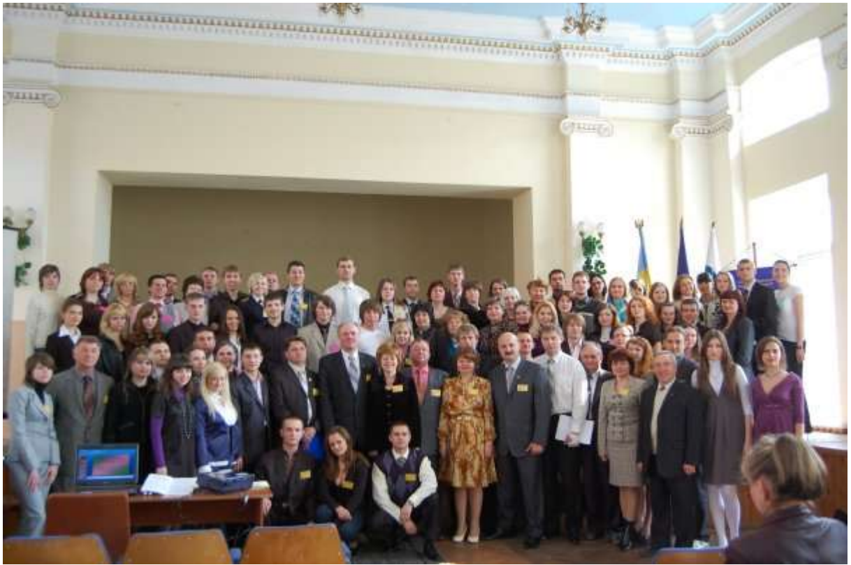
Участь учасників Школи лідерів учнівського самоврядування в роботі Всеукраїнської студентської науково-практичної конференції «Теорія і практика виховання лідерських якостей особистості». 2009 рік