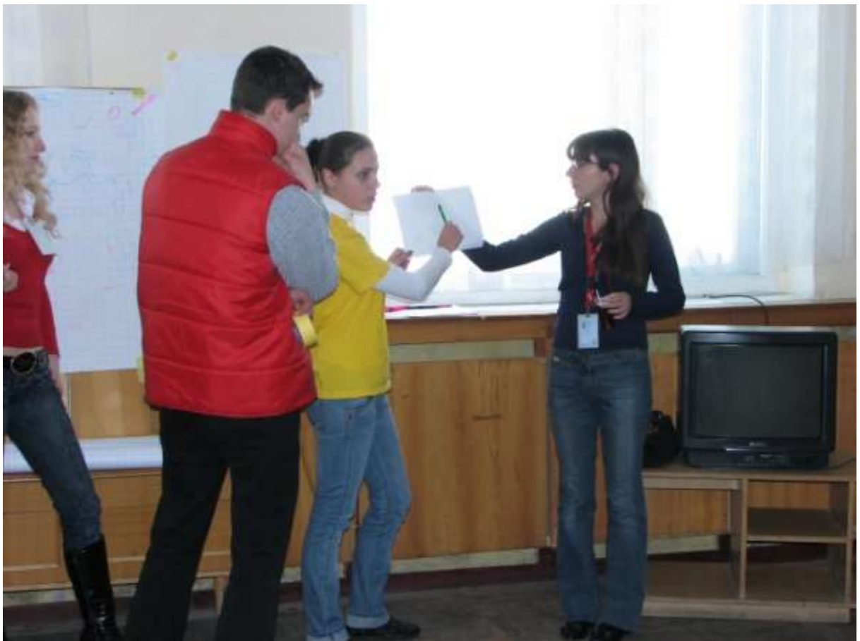
Робота в групах. Вправа «Мої права».