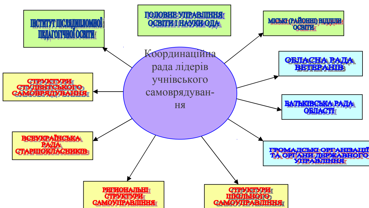
Схема 2. Взаємодія ради лідерів з органами самоврядування.

БАТЬКІВСЬКИЙ КОМІТЕТ ОБЛАСТІ – взаємодія зі службами дітей, піклувальними радами, захист прав дітей, підлітків і дорослих, розв'язання конфліктних ситуацій на рівні обласної ради.