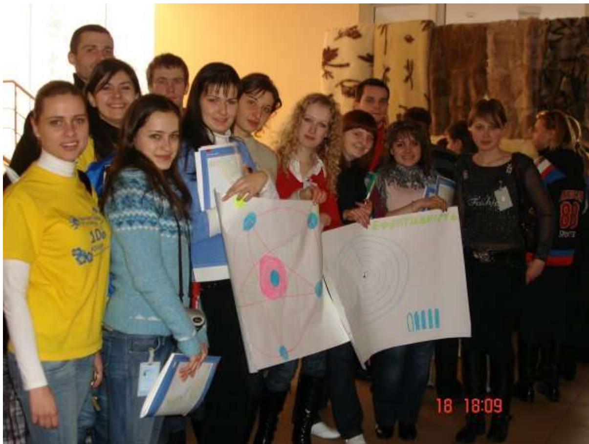
Учасники Школи лідерів учнівського самоврядування презентують свої напрацювання під час тренінгу

У пілотному проєкті на базі Нижньомлинської ЗОШ Полтавського р-ну