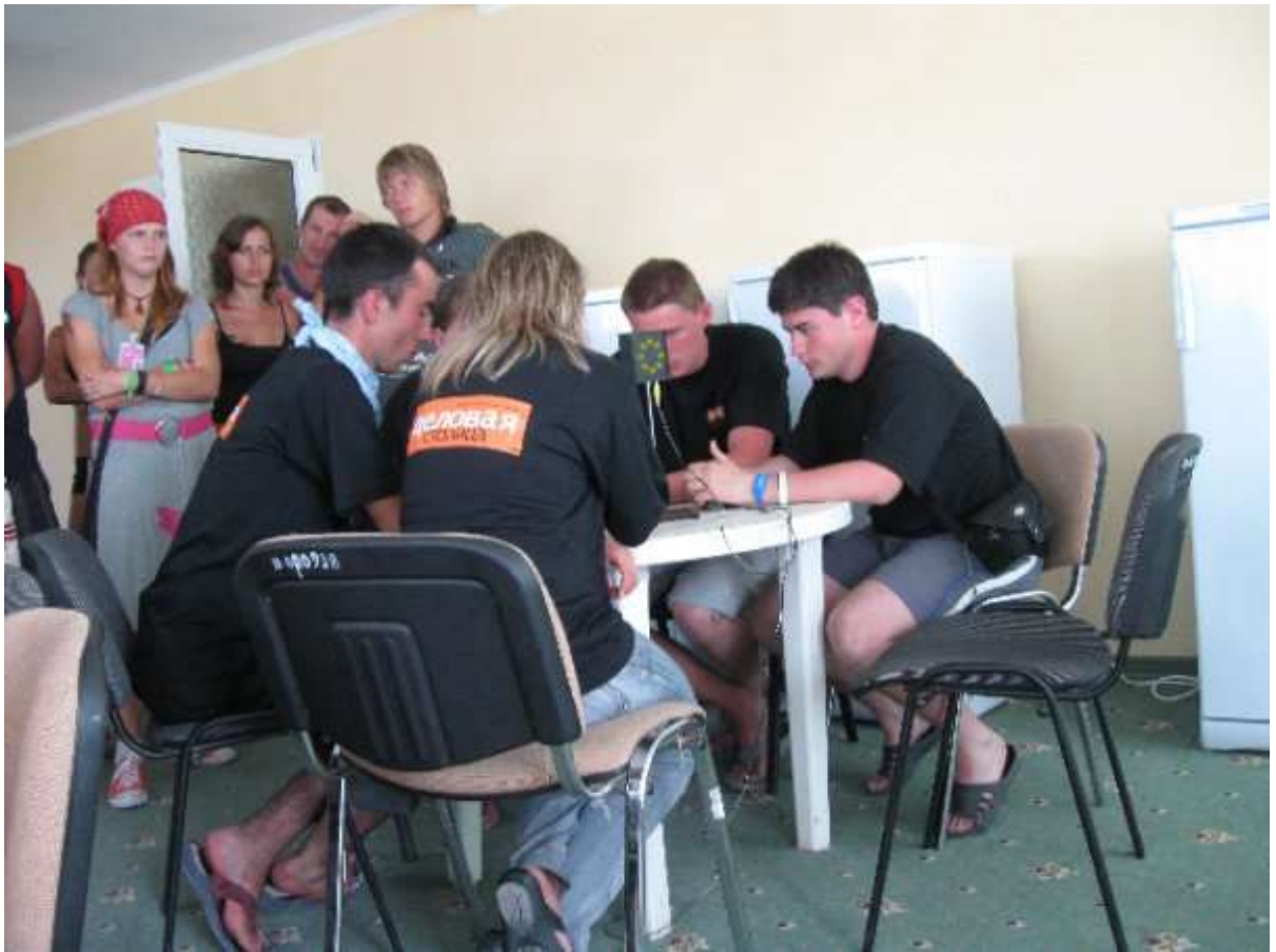
Ділова гра студентів та учасників Школи лідерів учнівського самоврядування.