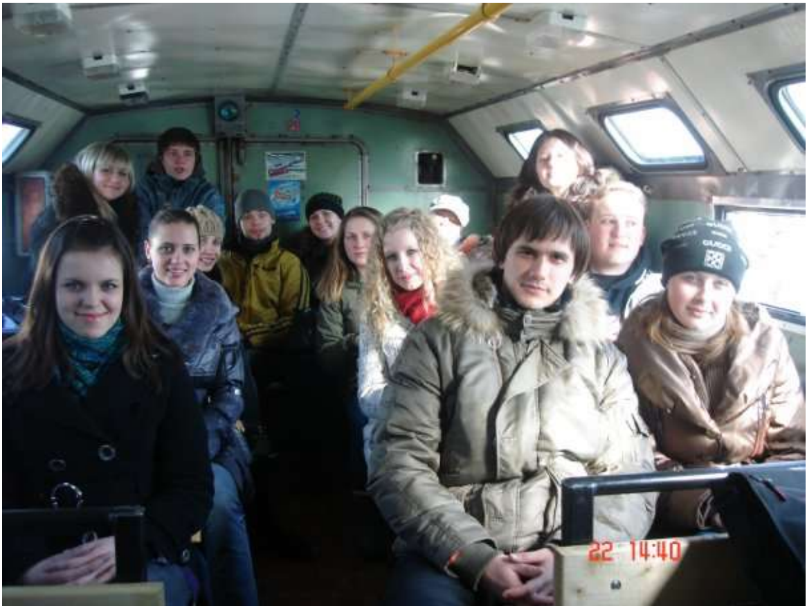
Учасники Школи лідерів учнівського самоврядування їдуть на зустріч з військовослужбовцями