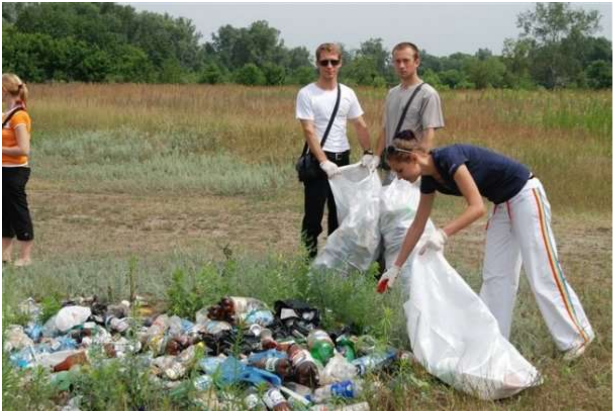
Акція «Зробимо чистою нашу планету»