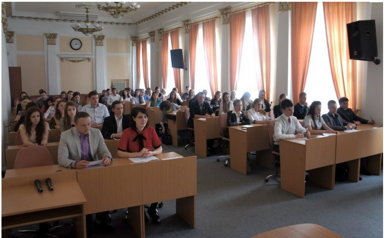
Рис. 3 Засідання Тернопільської школи “Молодь майбутнього”