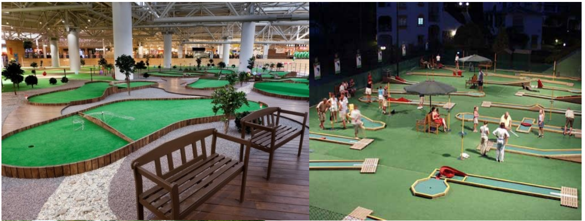
Це міні-гольф игра