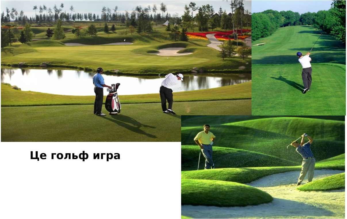
Це гольф игра