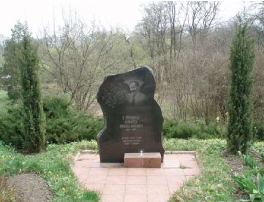
Рис. Б. 2. Пам'ятник М. М. Гришку.