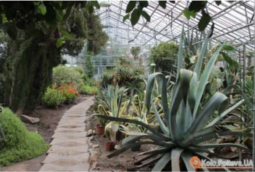
Рис. Б.1 Оранжерея площею 2000 м 2 .