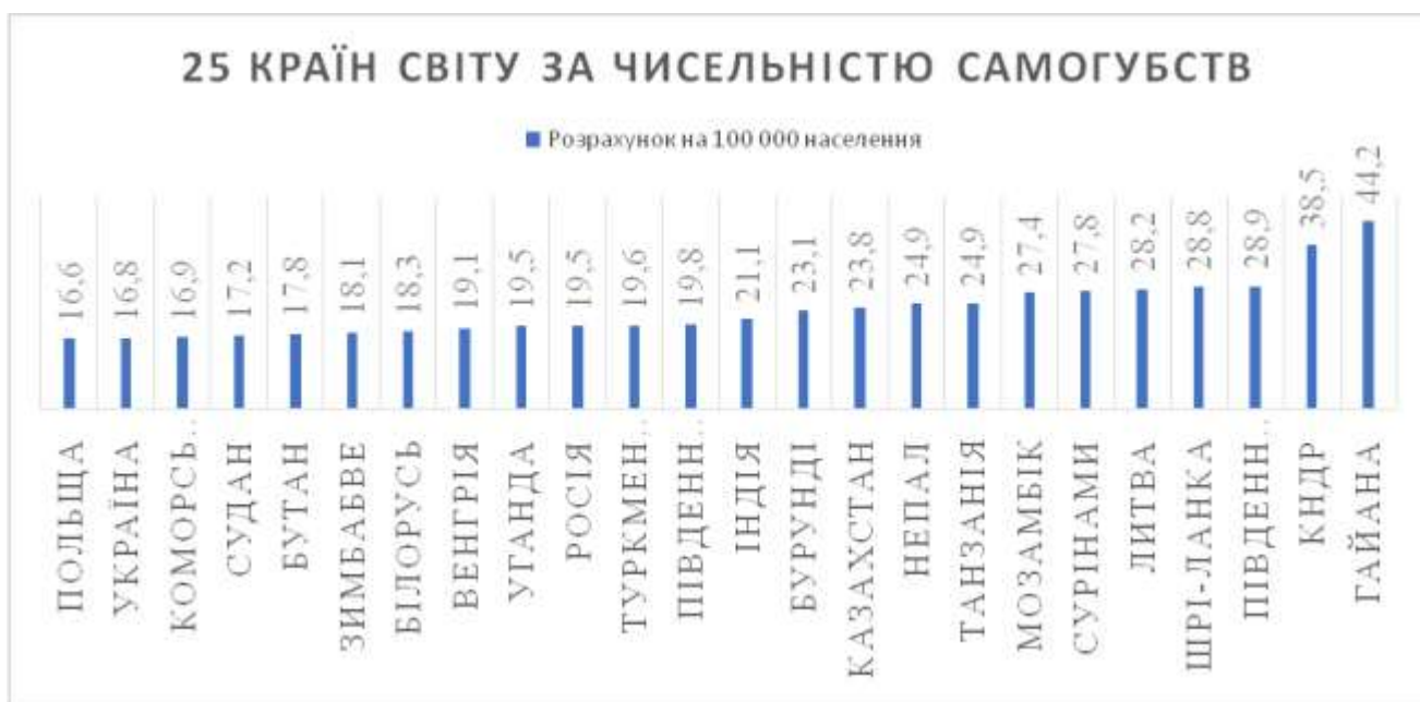
Рис. 2 – 25 країн світу за чисельністю самогубств

За даними інтернет-порталу «ИНТЕРЕСНЫЙ БЛОГ» [5] є топ 25 країн світу за кількістю самогубств на 100 000 населення.